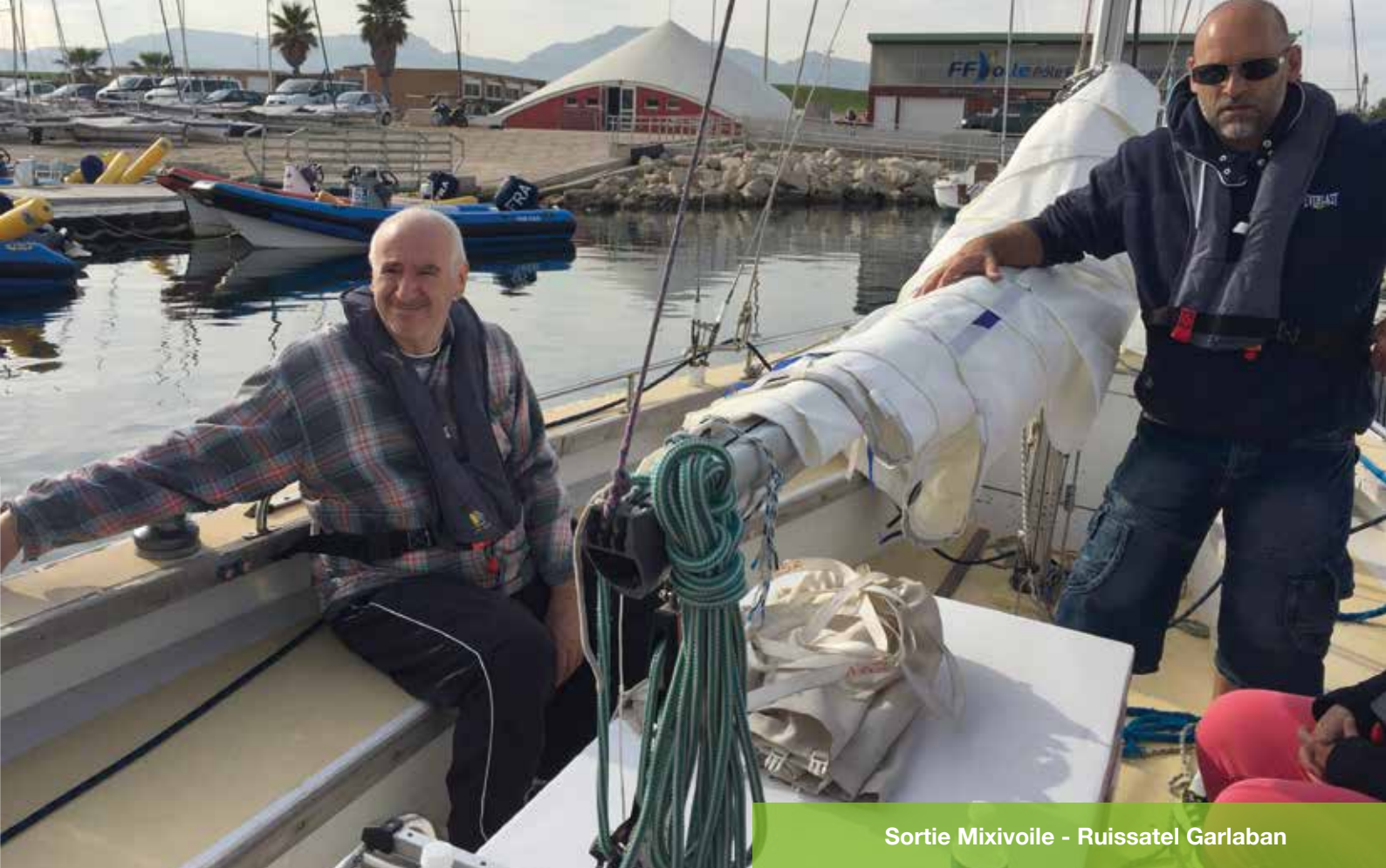
Sortie Mixivoile - Ruissatel Garlaban