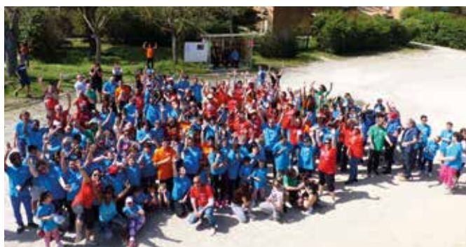
Cross IRSAM - avril 2018

En octobre 2017, à l'occasion de la nomination de Marseille comme Capitale du Sport, l'association IRSAM a organisé la 1 ère édition de « IRSAM en mouvement » proposant une randonnée dans les calanques de Marseille. Ce fut l'occasion de rencontres entre les résidents adultes des foyers de Marseille, Nice et Lyon avec les jeunes des Instituts d'Education Sensorielle Arc-en-Ciel, IRS de Provence et Les Primevères. Ce fut une belle réussite et des professionnels de l'IRS de Provence se sont inspirés de cet événement pour organiser au sein de leur établissement leur propre cross. C'est ainsi qu'en avril 2018, sur le site du CEPDA La Rémusade accueillant des jeunes adolescents sourds et malentendants et des foyers Ruissatel – Garlaban accueillant des adultes déficients auditifs avec handicap associé, près de 300 coureurs, de 10 à 60 ans, avec des handicaps différents, ont parcouru de 3 à 8 km, dans une ambiance conviviale et chaleureuse.