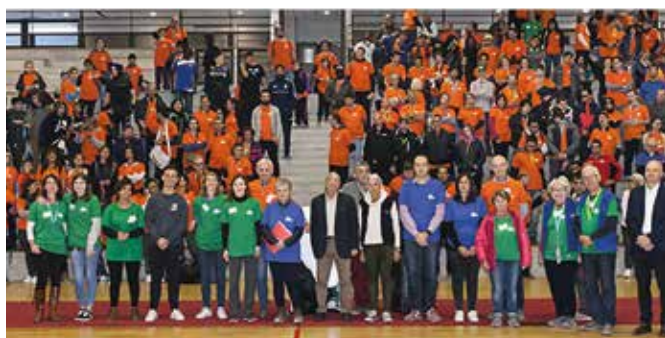
IRSAM en mouvement - octobre 2017