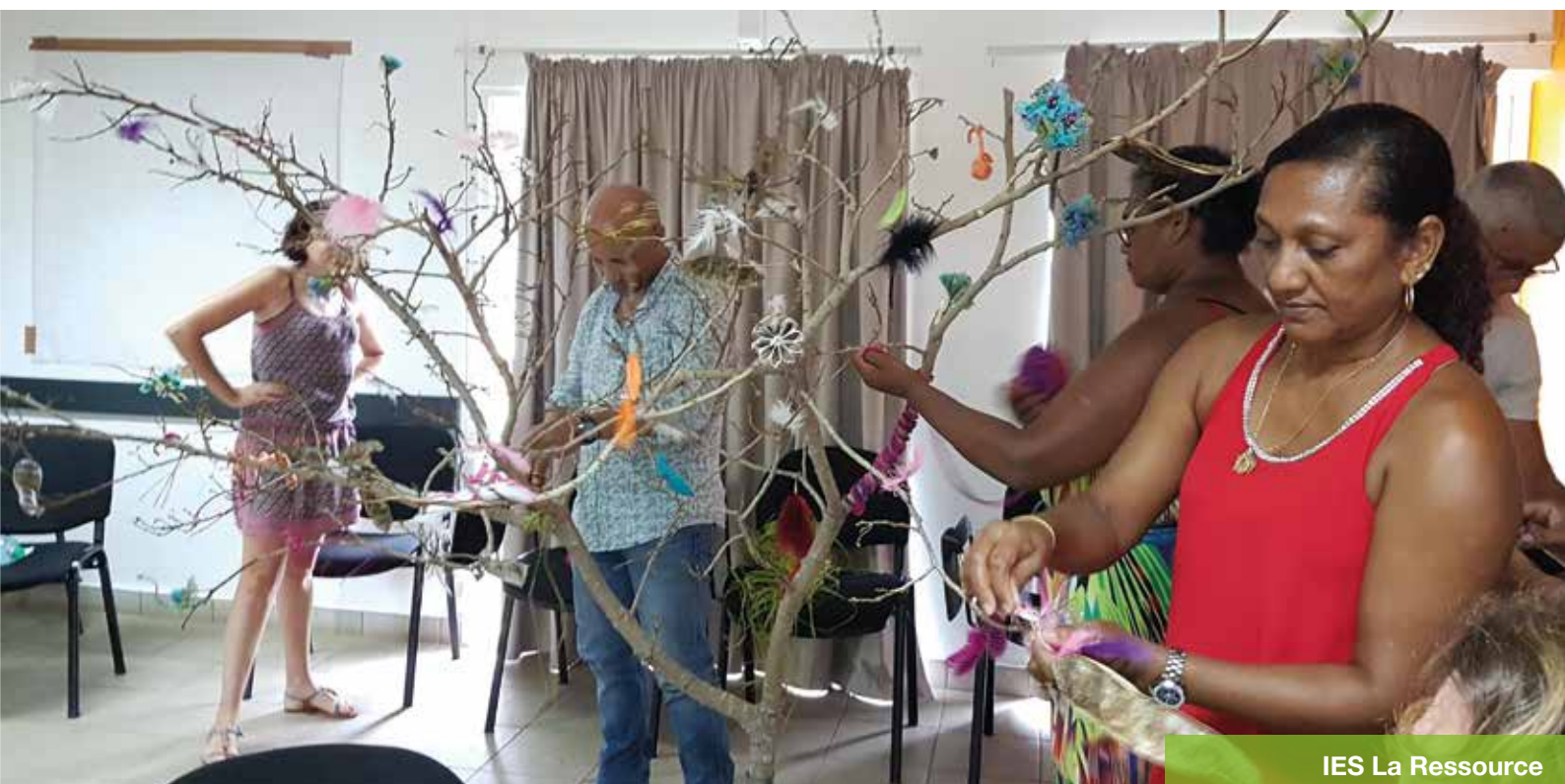
IES La Ressource

Deux établissements réunionnais, le CMPP, qui intervient auprès des jeunes de 3 à 18 ans présentant des troubles du langage et des apprentissages et l'IES La Ressource (DV et DA), ont privilégié des méthodologies innovantes dans la mise en œuvre de la démarche.